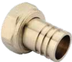
HAREKETLİ NİPEL / TRANSITION NIPPLE مرحلة انتقالية الحلمة / ПЕРЕХОДНОЙ НИППЕЛЬ