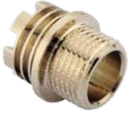
DIŞ DİŞLİ İNSÖRT / MALE INSERT توصيلة ذكر / МУФТА С НАРУЖНОЙ РЕЗЬБОЙ