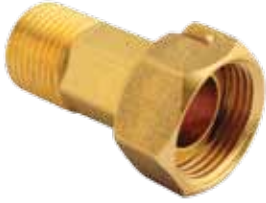
SU SAYACI ANAHTAR AĞIZLI REKOR TAKIMI / WATER METER UNION HEXAGONAL المياه متر الاتحاد سداسية / СОЕДИНЕНИЕ К СЧЕТЧИКУ