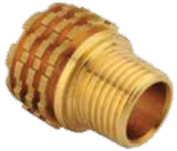
DIŞ DİŞLİ İNSÖRT / MALE INSERT توصيلة ذكر / НАТУРАЛЬНАЯ МУФТА С НАРУЖНОЙ РЕЗЬБОЙ