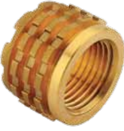
İÇ DİŞLİ İNSÖRT / FEMALE INSERT توصيلة أنثى / НАТУРАЛЬНАЯ МУФТА С ВНУТРЕННЕЙ РЕЗЬБОЙ