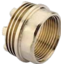
İÇ DİŞLİ ANAHTAR AĞIZLI İNSÖRT / HEXAGONAL FEMALE INSERT توصيل الإناث سداسية / МУФТА ШЕСТИУГОЛЬНАЯ С ВНУТРЕННЕЙ РЕЗЬБОЙ