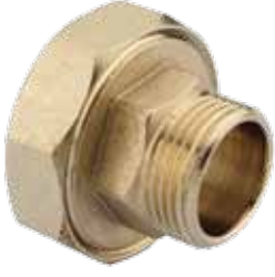
OYNAR BAŞLI REKOR ERKEK / TRANSITION UNION - MALE ذكر الاتحاد الانتقال / МУФТА РАЗЪЕМНАЯ С НАРУЖНОЙ РЕЗЬБОЙ