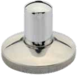
ANKASTRE VANA ÜST GÖVDE / CHROME PLATED VALVE BUILD-IN الكروم لوکس صمام مطلي / КЛАПАНЬ СКРЫТНЫЙ