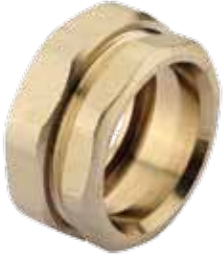
İKİ TARAFLI KAYNAKLI REKOR / TRANSITION UNION DOUBLE SIDED FEMALE/MALE الانتقال الاتحاد ذكر / أنثى / ДВУХСТОРАННАЯ МУФТА