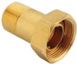
SU SAYACI REKOR TAKIMI / WATER METER UNION الاتحاد عداد المياه / ШЕСТИУГОЛЬНАЯ СОЕДИНЕНИЕ К СЧЕТЧИКУ